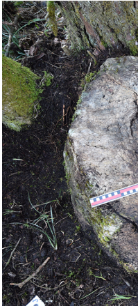
Bloc à cupules n°5