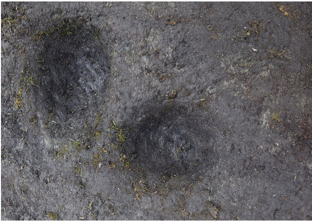
Détail du groupe de cupules du bloc n°1